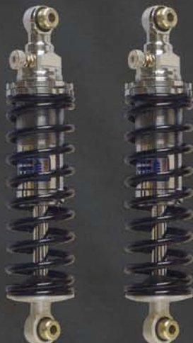
BI-AMORTISSEUR CUSTOM CHROME