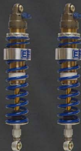
SPORTSHOCK DOUBLE RÉGLAGE DOUBLE RESSORT AVEC CORRECTEUR D'ASSIETTE