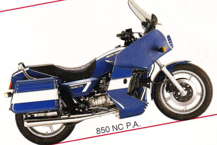
850 NC P.A.