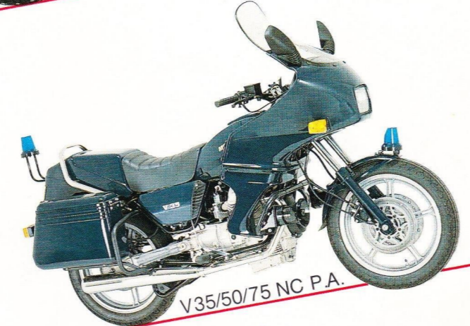
V35/50/75 NC P.A.