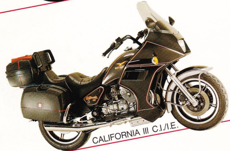
CALIFORNIA III C.I./E.