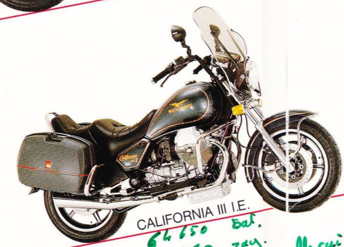
CALIFORNIA III I.E. 64,650 bal. 65,880 tag. 67,280 - sello cuir.