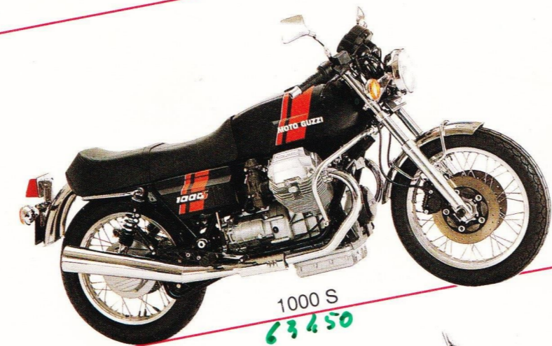
1000 S 63,450