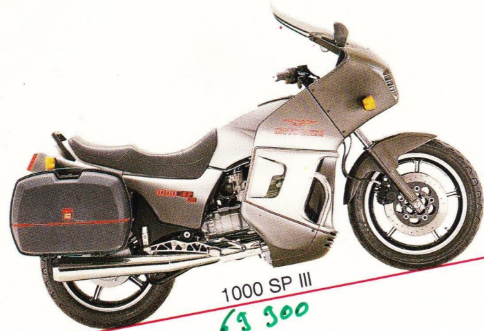
1000 SP III 69,900