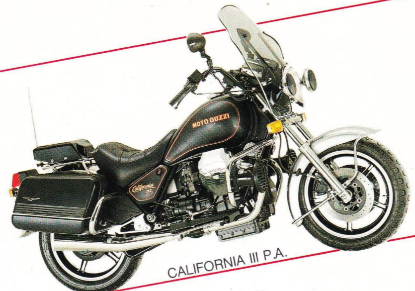
CALIFORNIA III P.A.