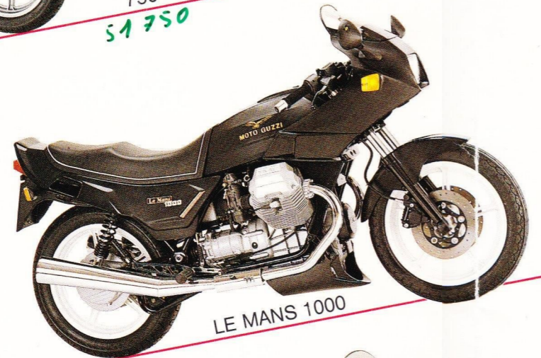
LE MANS 1000