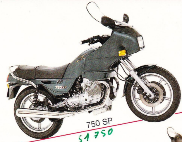
750 SP 51,750