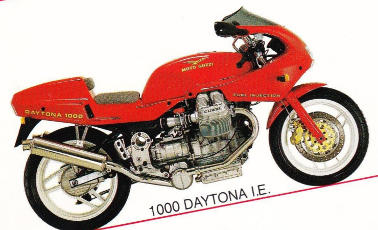
1000 DAYTONA I.E.