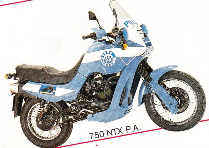
750 NTX P.A.