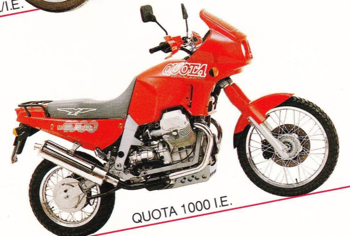
QUOTA 1000 I.E.