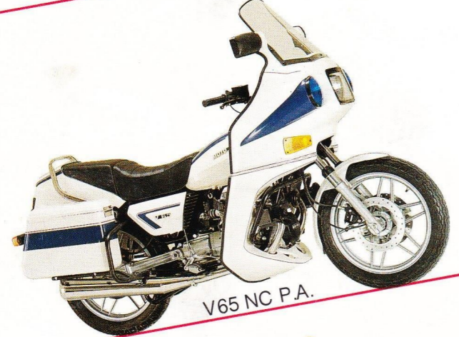
V65 NC P.A.